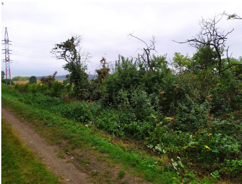
Obr. 3 Pohled na část porostu C v biokoridoru LBK 10