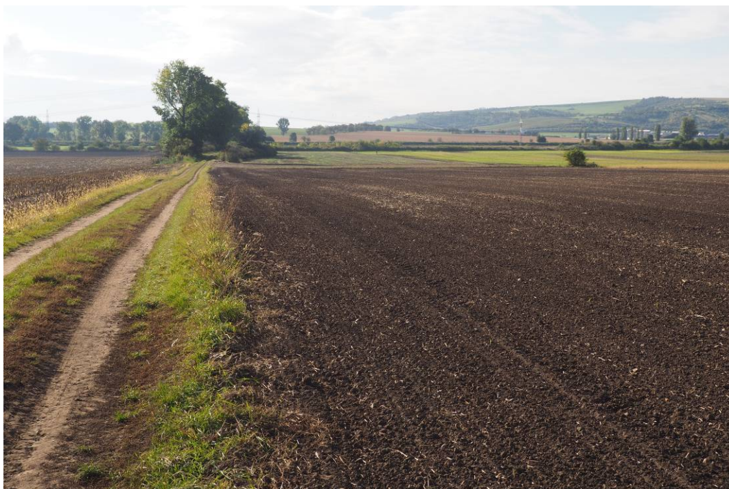
Obr. 9 Pohled ze severu na stávající ornou půdu, kde bude realizován biokoridor LBK 10, v pozadí je stávající porost, který je součástí biokoridoru