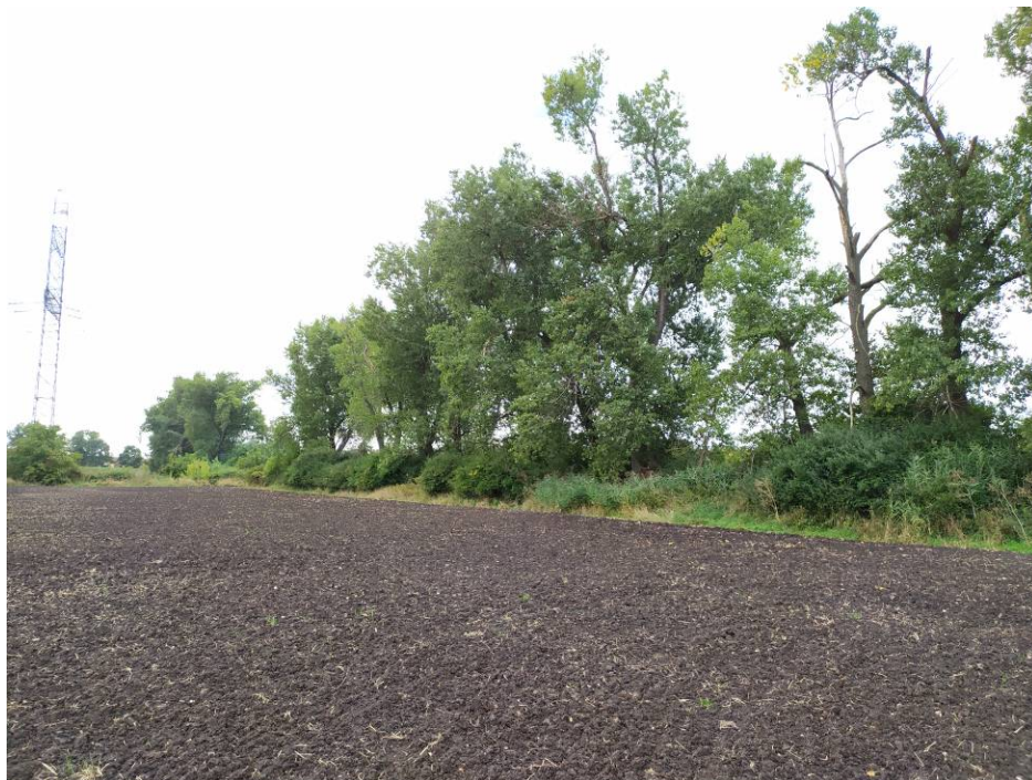
Obr. 1 Pohled na stávající porost a topoly navržené ke kácení