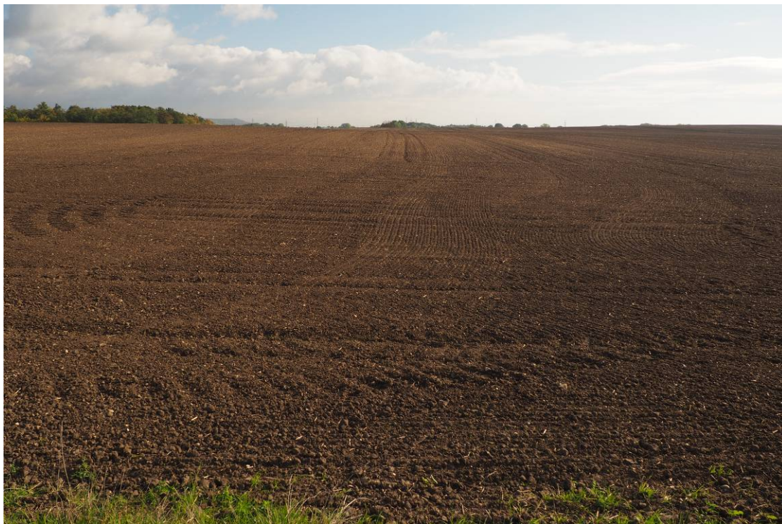
Obr. 15 Pohled na stávající ornou půdu, kde bude realizován biokoridor LBK 11a