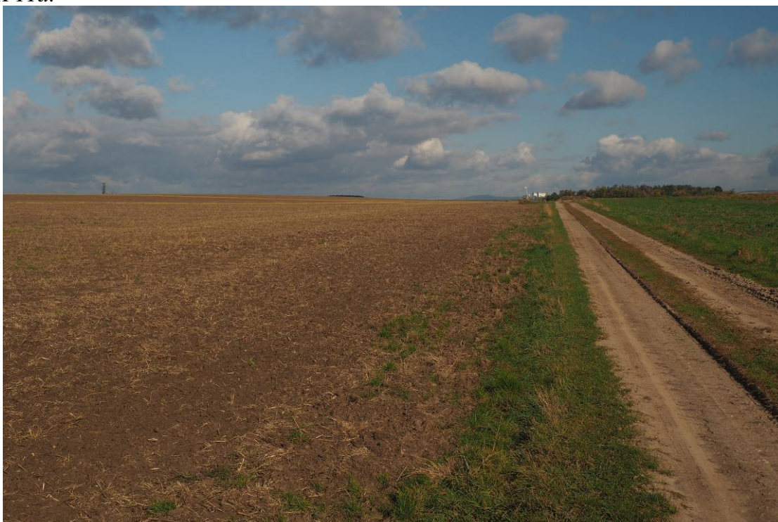
Obr. 14 Pohled na stávající ornou půdu, kde bude realizován biokoridor LBK 11a