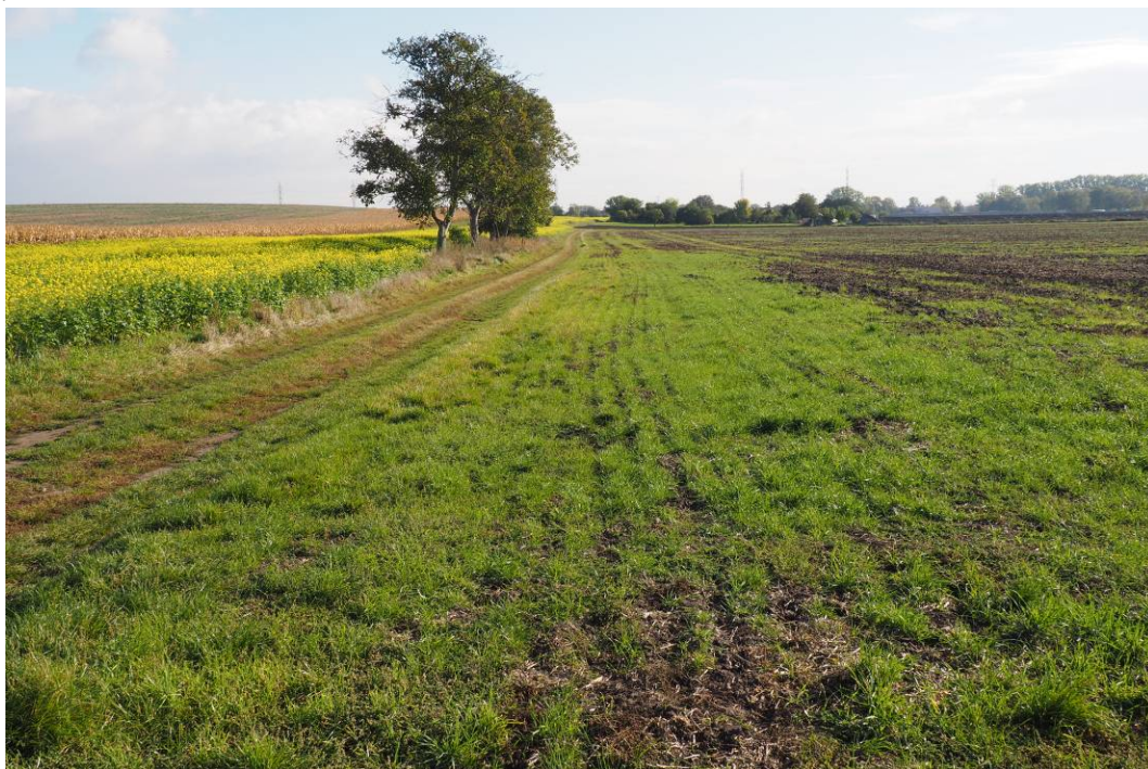
Obr 17. Pohled na stávající ornou půdu, kde bude realizován větrolam IP 24