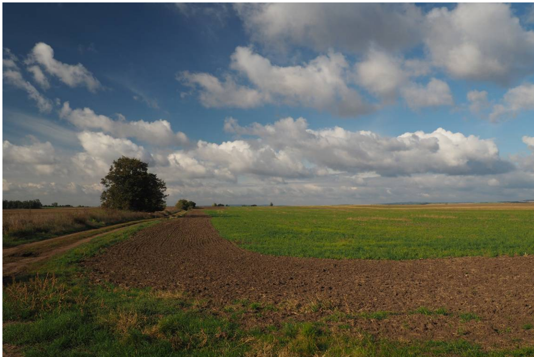
Obr. 13 Pohled na stávající ornou půdu, kde bude realizováno biocentrum LBC Žerotín