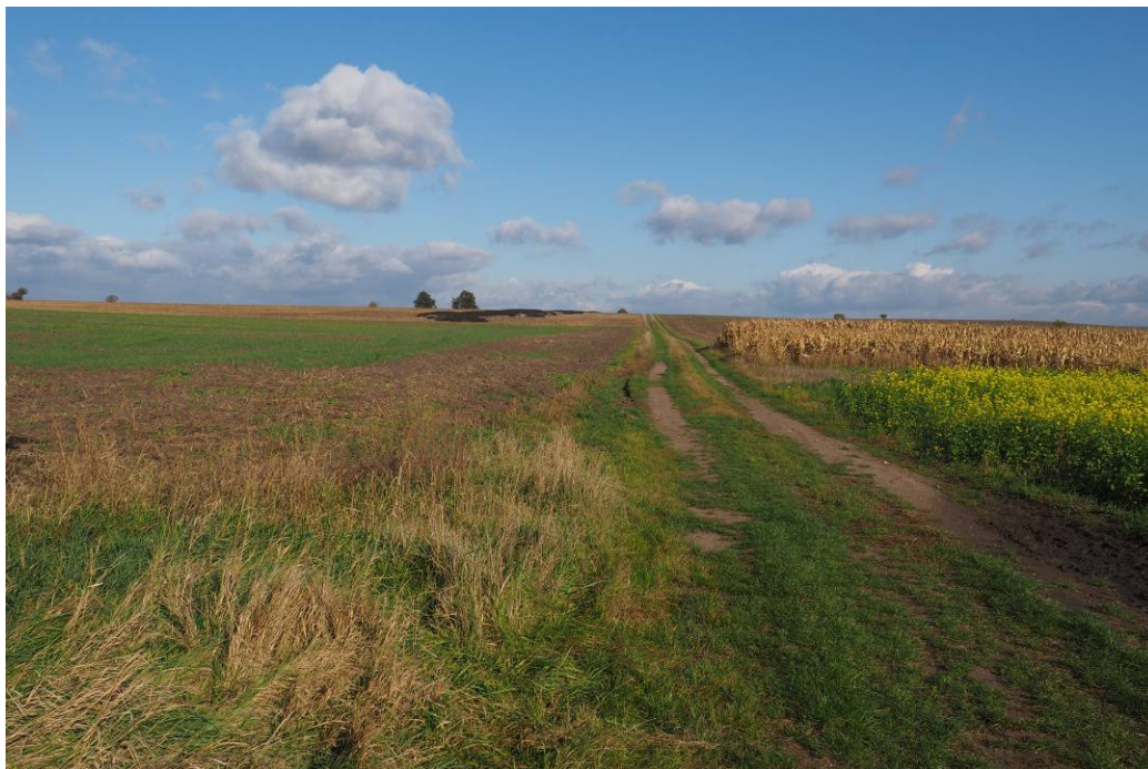
Obr. 11 Pohled na stávající ornou půdu, kde bude realizován biokoridor LBK 10