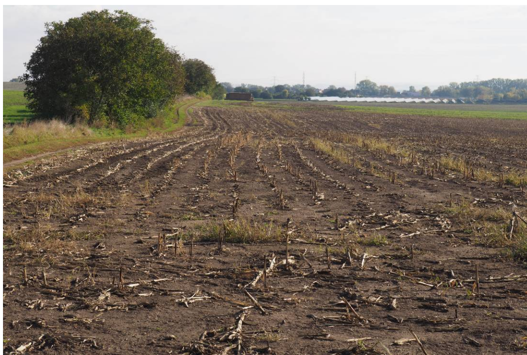
Obr. 10 Pohled na stávající ornou půdu, kde bude realizován biokoridor LBK 10