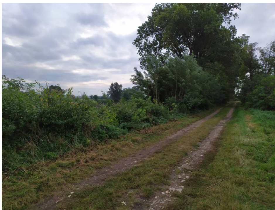
Obr. 2 Pohled na část stávajícího porostu v biokoridoru LBK 10