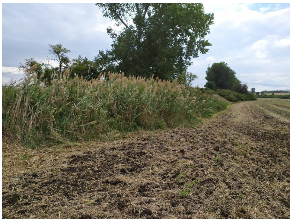
Obr. 4 Pohled na stávající zeleň v biokoridoru LBK 10 ze severu