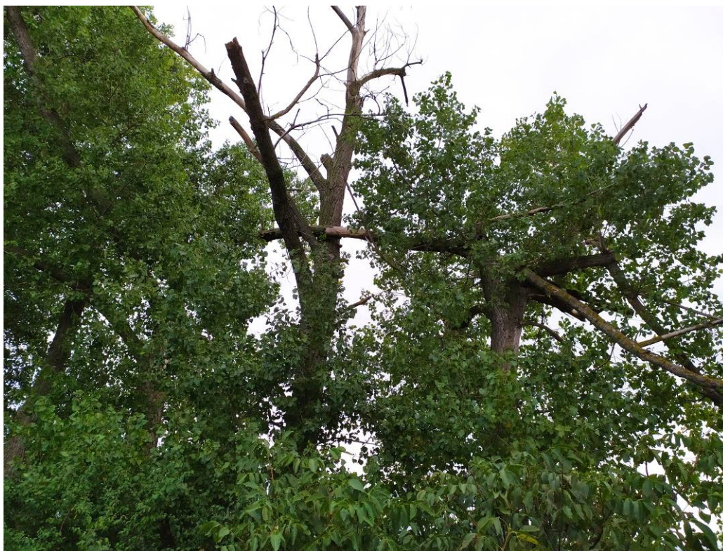
Obr. 7 Pohled na poškozené stromy navržené ke kácení v biokoridoru LBK 10