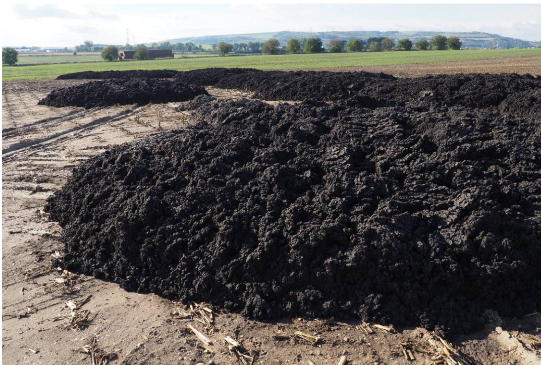
Obr. 12 substrát neznámého složení a původu v prostorách navrženého biokoridoru LBK 10