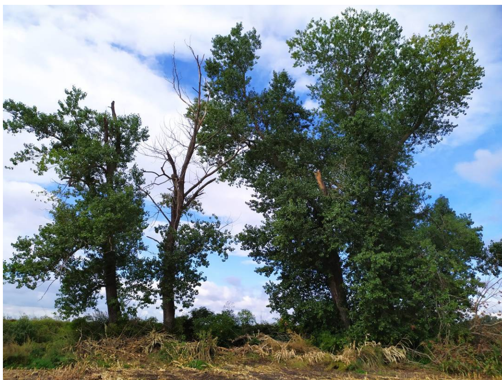
Obr. 8 Pohled na poškozené stromy navržené ke kácení v biokoridoru LBK 10