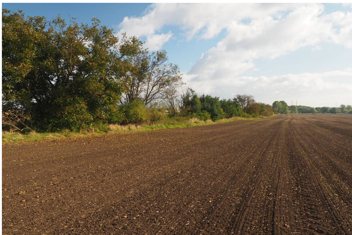
Obr. 16 Pohled na stávající porost, který je součástí biokoridoru LBK 11a