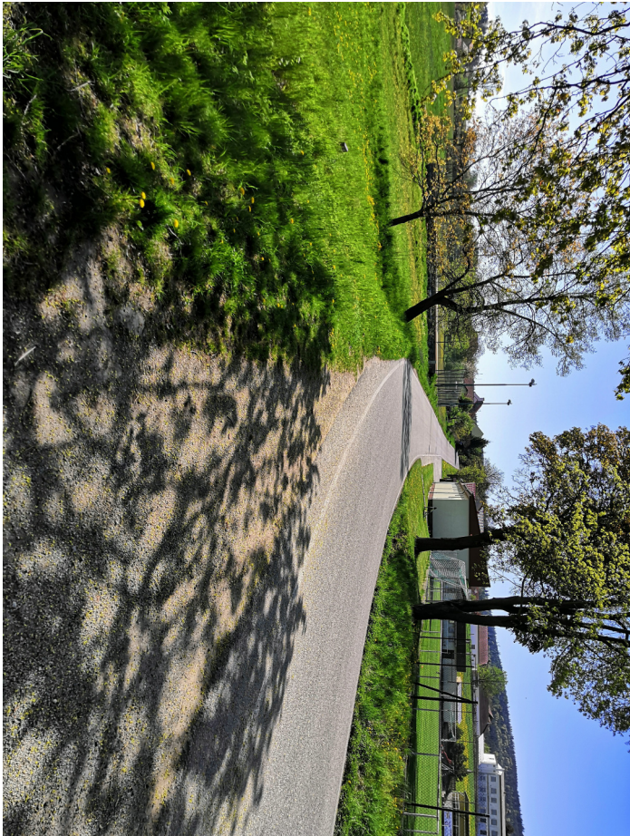
Pohled vlevo směrem do Jankova