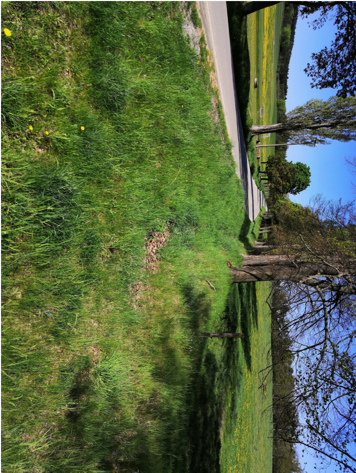
Pohled vpravo směrem do Holašovic

Na začátku se cesta napojuje na silnici III/14324 vedoucí z Jankova do Holašovic. Rozhledové poměry tohoto napojení byly posouzeny dle ČSN 736109 čl. 11.2.1. Napojení se nachází na vnější straně směrového oblouku silnice III/14324 o poloměru R=40 m. Dle ČSN 736102 čl. 5.2.9.1.1 je mezní rychlost v tomto oblouku v_m=40 km/h. Na tento směrový oblouk jsou řídící varování SDZ A1a resp. A1b a SDZ Z3. Dosahovaná délka pro zastavení je 120 m což odpovídá dovolené rychlosti 90 km/h. Odsazení rozhledu z polní cesty je 3 m. Rozhledové poměry vyhovují.