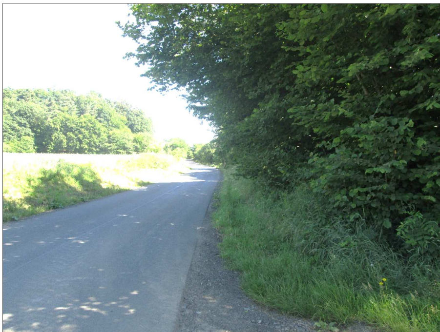
Rozhled vpravo v místě napojení na silnici III/14323