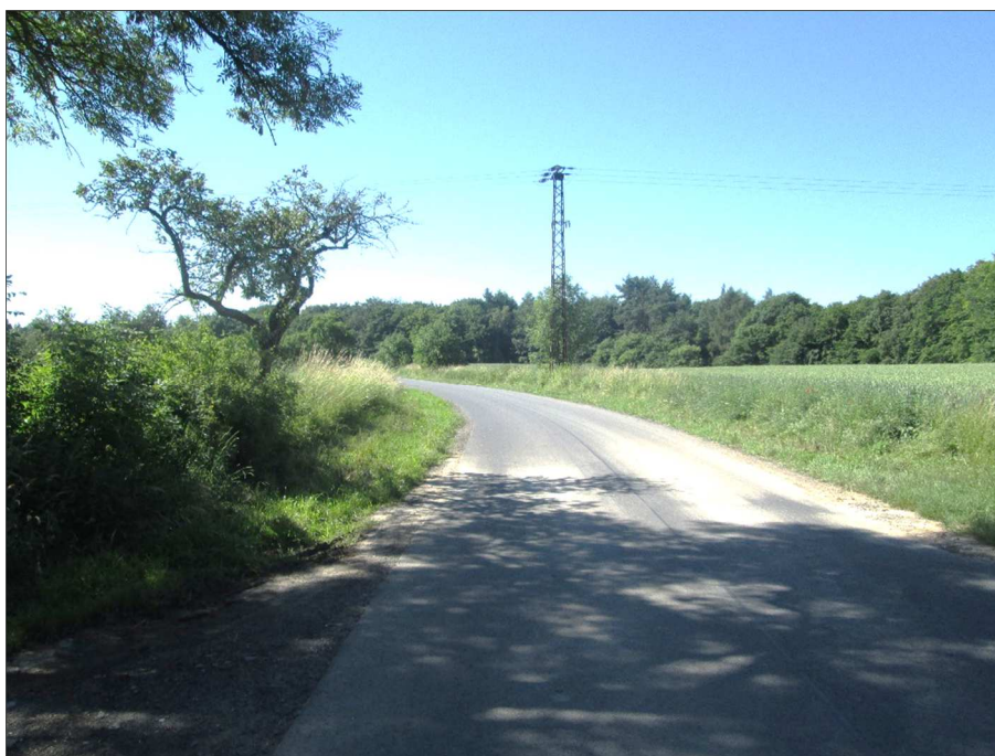
Rozhled vlevo v místě napojení na silnici III/14323