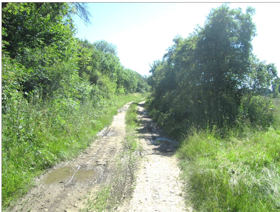
Trasa polní cesty HC4