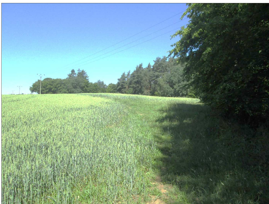
Konec úpravy polní cesty