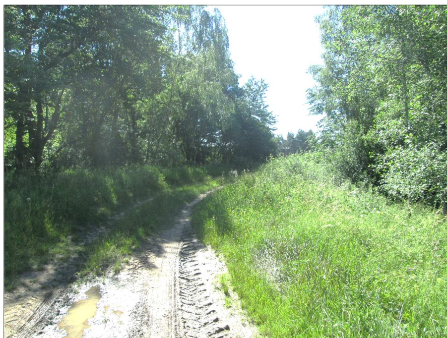
Trasa polní cesty HC4