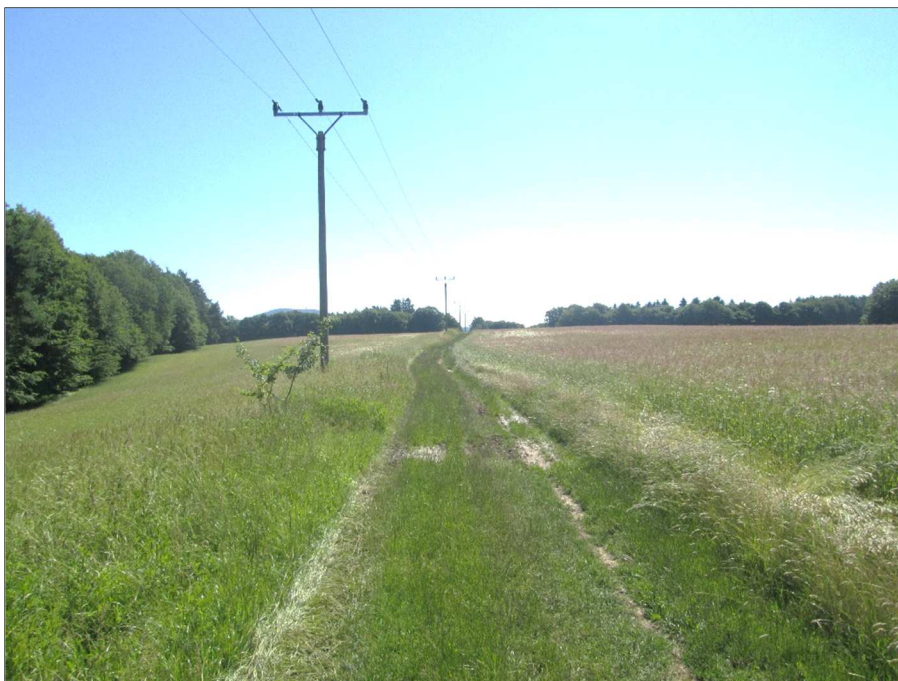
Průběh trasy polní cesty – souběh s nadzemním vedením VN