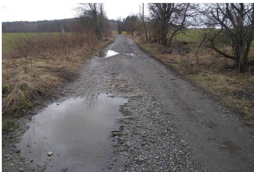
Obr 4: Aktuální stav cesty HC2b v cca km 0,2. V detailu patrné štětování původní cesty. Cesta nevykazuje sníženou únosnost náspu ani podloží.