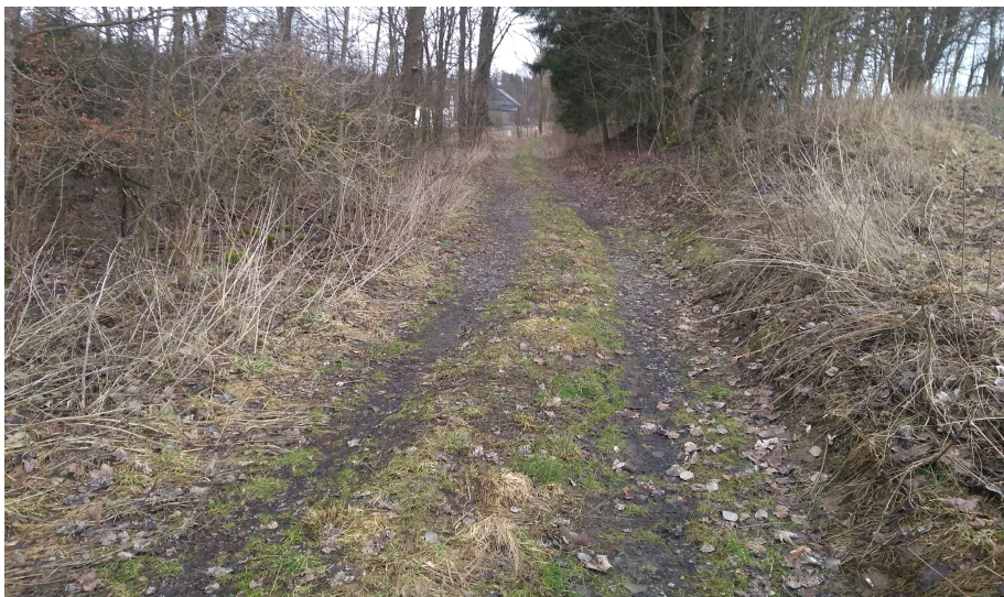
Obr 7: Aktuální stav cesty HC2c v cca km 0,45. Cesta nevykazuje sníženou únosnost podloží. Povrch cesty v tomto úseku není zatěžován těžkou nákladní dopravou.

Cesta HC1 v celém úseku navrhované rekonstrukce nevykazuje žádné závady v únosnosti konstrukčních vrstev. Cesta je dlouhodobě využívána zejména pro dopravu dřeva z lesa a nevykazuje žádné známky poškození náspu, což je obvyklé u cest s nižší únosností při používání vozidel koncepce Tatra.