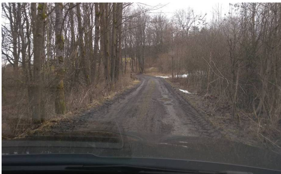
Obr 5: Aktuální stav cesty HC2b v cca km 0,75. Cesta je vedena v náspu v sedimentech údolní nivy. Cesta nevykazuje sníženou únosnost náspu.

Pro úsek HC2b km 0,9 – 1,3 a HC2c km 0,0 – 0,2 a km 0,25 - 0,35 doporučujeme založení cesty na hutněný násep z kameniva cca 0,4 m mocný. Podloží nedostatečně únosné bez zjevného zamokření – viz Obr. 6 . Do náspu doporučujeme zpracovat stávající povrch polní cesty. V úseku HC2c cca km 0,20 – 0,25 je terén mírně podmáčený, zde doporučujeme založit násep o mocnosti cca 0,8 m na geomříž.