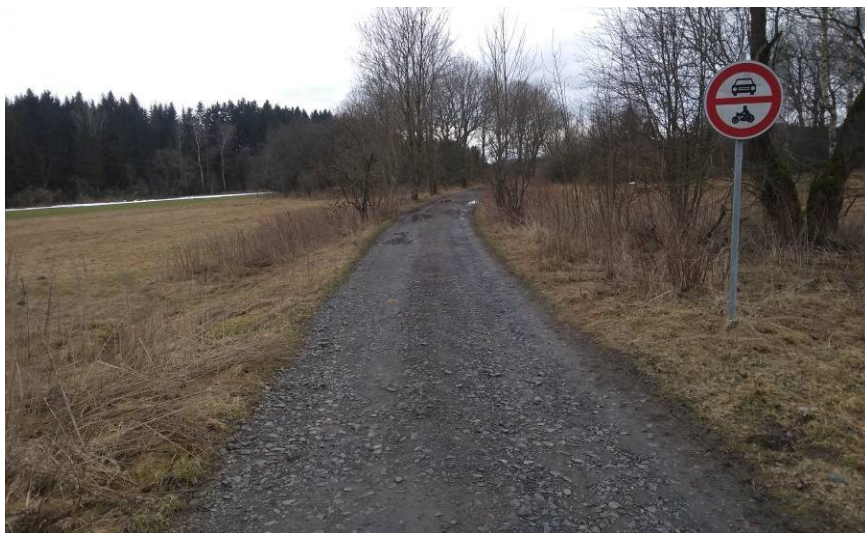
Obr 3: Aktuální stav cesty HC2b v cca km 0,1. Cesta s povrchem ze ztuhlého kameniva nevykazuje sníženou únosnost náspu a podloží.

V případě cesty HC2b úsek km 0,0 – 0,9, kde je cesta vedena v náspu je problematické rozšíření náspu. Stávající násep je za dlouho dobu provozu stabilizován a při jeho rozšíření třeba provést z materiálu s rozhodujícím podílem kameniva (obdobu stávajícího materiálu) a dostatečně ztuhnout.