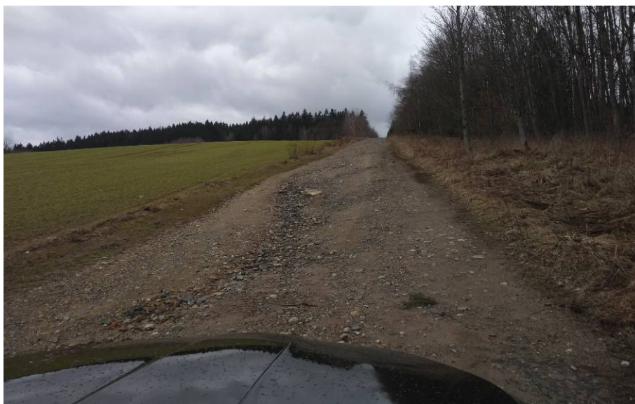
Obr 9: Aktuální stav cesty HC1c v cca km 0,35 – 0,45. Cesta nevykazuje sníženou únosnost náspu ani podloží. Povrch cesty v tomto úseku je zatěžován těžkou nákladní dopravou – transport dřeva. Jedná se o dobře hutněný násep podél „hraničního plotu z počátku 70. let 20. století.