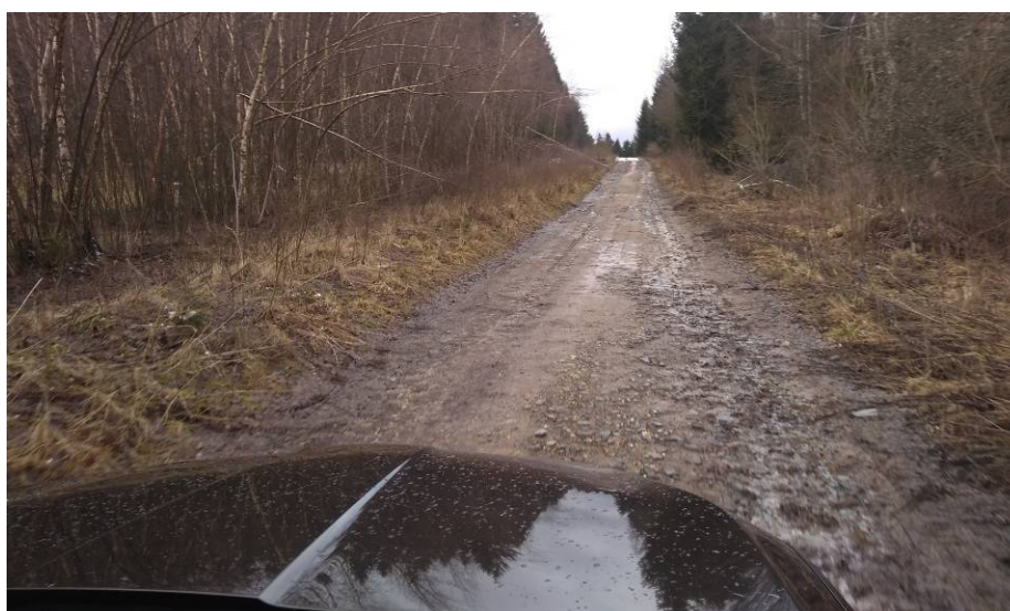
Obr 10: Aktuální stav cesty HC1c v cca km 0,35 – 0,45. Cesta nevykazuje sníženou únosnost náspu ani podloží. Povrch cesty v tomto úseku je zatěžován těžkou nákladní dopravou – transport dřeva. Jedná se o dobře hutněný násep podél „hraničního plotu z počátku 70. let 20. století.

Cesty VC14a a VC 14b jsou navrženy v písčitých hlínách (dle ČSN 736133 F5 ML a F3 MS, dle ČSN EN ISO 14688-2 sasiCl až saClsi SiL ) se nachází i v sondě S3, v hloubce 0,20 – 3,00 m obdobně v sondě S7. Jsou hodnoceny jako podmíněně vhodné do podloží i podmíněně vhodné do náspu. Vzhledem k předpokládané nízké intenzitě využití nenavrhujeme úpravu (zlepšení podloží). Po skrytí kulturní vrstvy (ornice) o mocnosti 03 – 0,45 m doporučujeme založení cesty na hutněný násep z kameniva cca 0,4 m mocný.