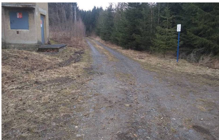
Obr 6: Aktuální stav cesty HC2c v cca km 0,35. Cesta nevykazuje sníženou únosnost náspu ani podloží.

Pro úsek HC2b km 0,9 – 1,3 a HC2c km 0,0 – 0,2 a km 0,25 - 0,35 doporučujeme založení cesty na hutněný násep z kameniva cca 0,4 m mocný. Podloží nedostatečně únosné bez zjevného zamokření – viz Obr. 6 . Do náspu doporučujeme zpracovat stávající povrch polní cesty. V úseku HC2c cca km 0,20 – 0,25 je terén mírně podmáčený, zde doporučujeme založit násep o mocnosti cca 0,8 m na geomříž.