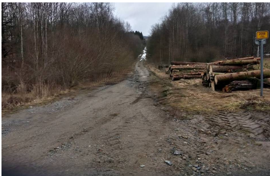
Obr 8: Aktuální stav cesty HC1c v cca km 0,10 – 0,20. Cesta nevykazuje sníženou únosnost náspu ani podloží. Povrch cesty v tomto úseku je zatěžován těžkou nákladní dopravou – transport dřeva. Jedná se o dobře hutněný násep podél „hraničního plotu z počátku 70. let 20. století.

Pro rekonstrukci doporučujeme zabránit soustředěnému odtoku povrchové vod po vozovce (např. u místěním příčných svodnic). Provést novou vozovku s využitím stávajícího materiálu.