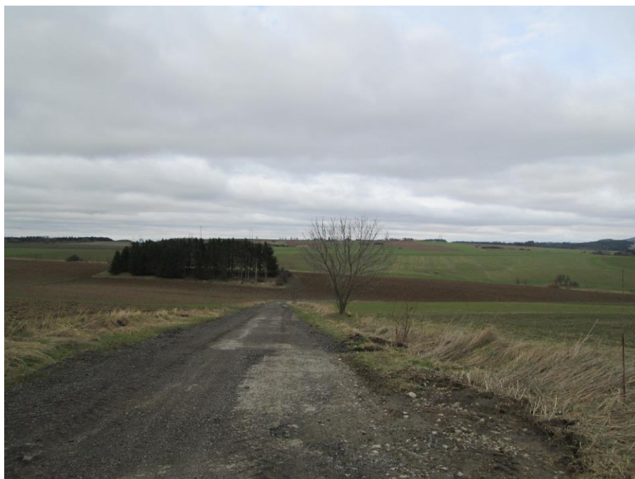
Průběh trasy polní cesty