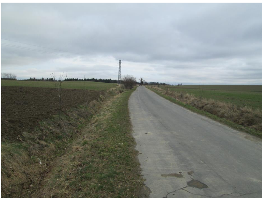
Rozhled vlevo na začátku úpravy