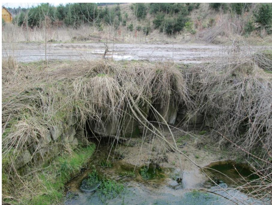
Vtok do propustku v nejnižším místě cesty