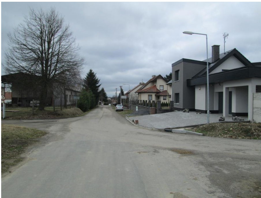
Rozhled vpravo na začátku úpravy