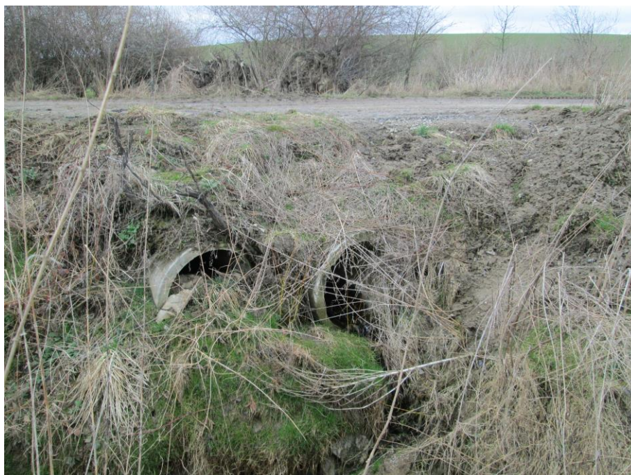
Výtok z propustku v nejnižším místě cesty