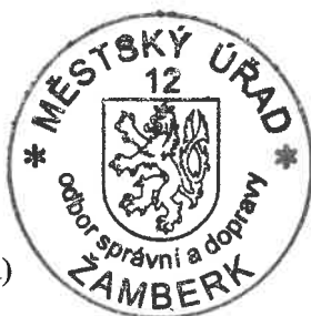
Bc. Petra Luňáčková, DiS. referent (oprávněná úřední osoba)

Lhůta pro podání odvolání se počítá ode dne následujícího po doručení písemného vyhotovení rozhodnutí, nejpozději však po uplynutí desátého dne ode dne, kdy bylo nedoručené a uložené rozhodnutí připraveno k vyzvednutí.