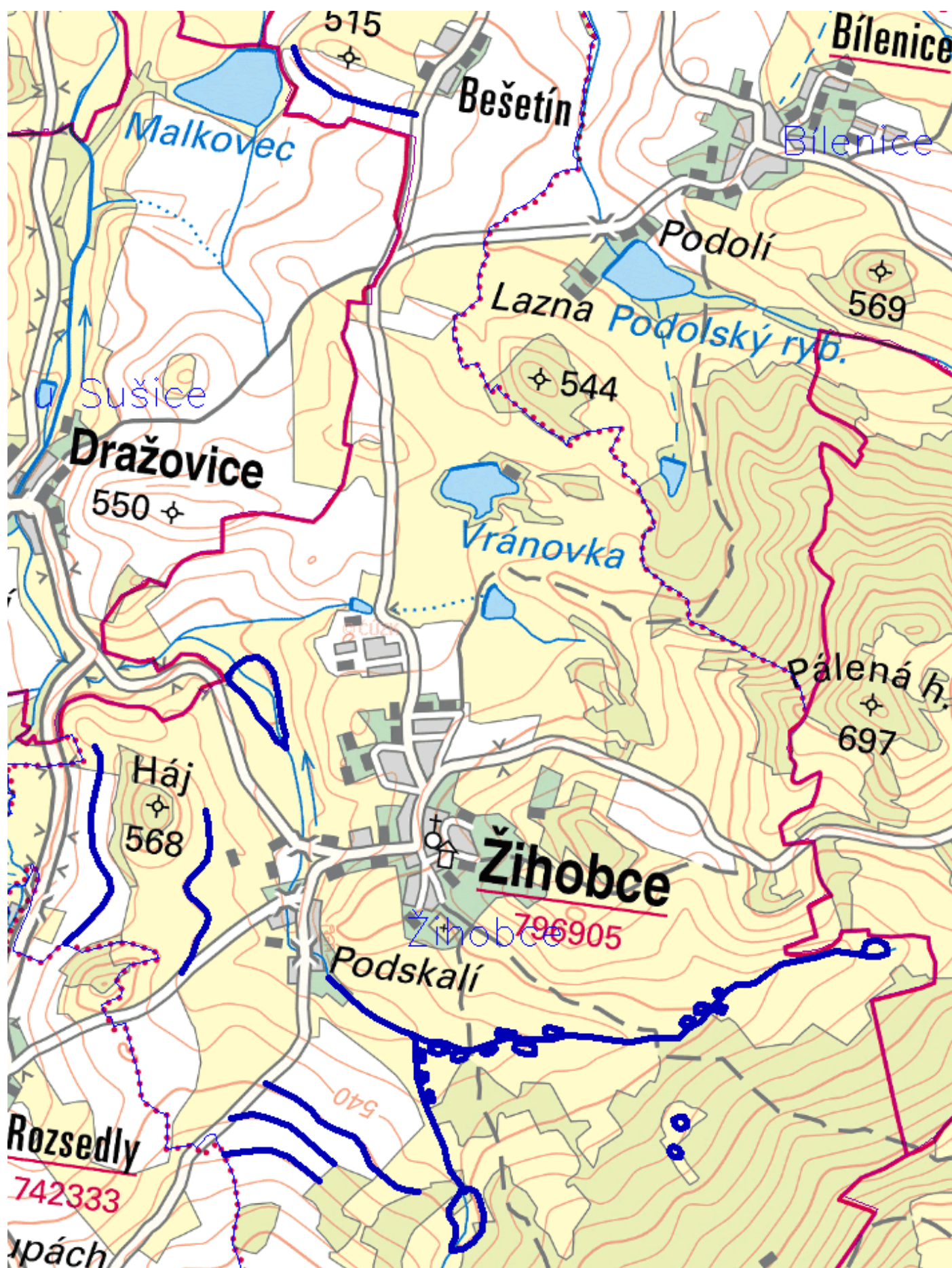
Obr. 1 návrh VHO a PEO opatření