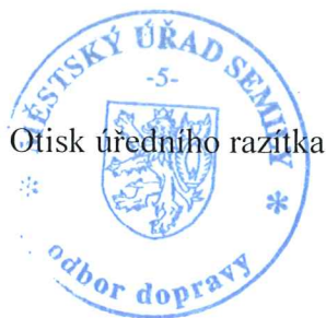
Otisk úředního razítka