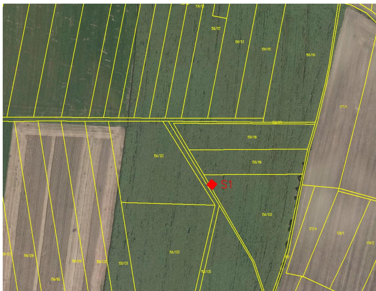
Obr. 4: Detailní situace S1

S1 bude umístěna v ose tělesa uvažované hráze, v jejím nejnižším místě, kde bude výpustní zařízení této hráze