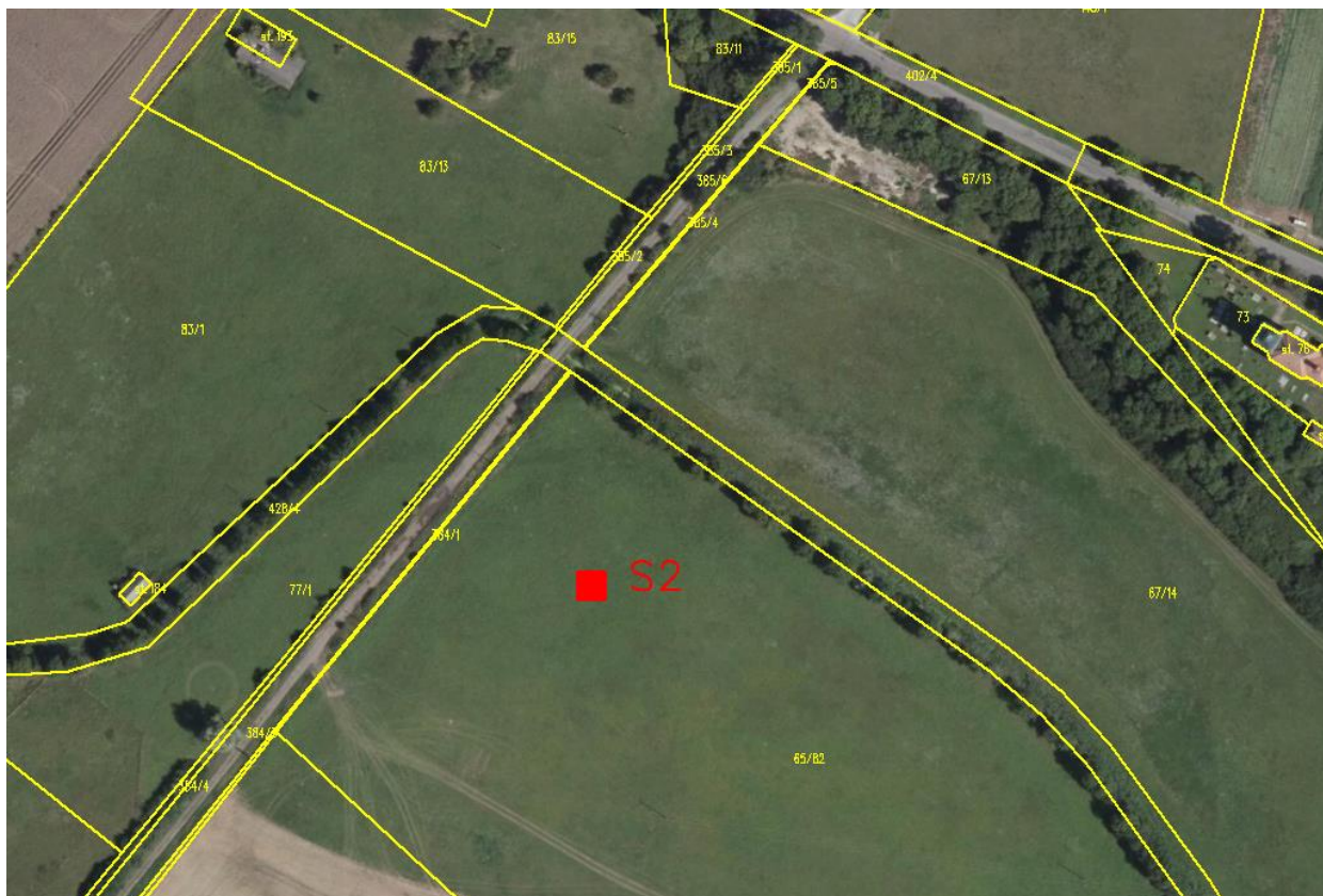
Obr. 5: Detailní situace S2

S2 bude umístěna v místě navržené tůně, což je zároveň uvažovaný zemník pro stavbu ochranné hráze.