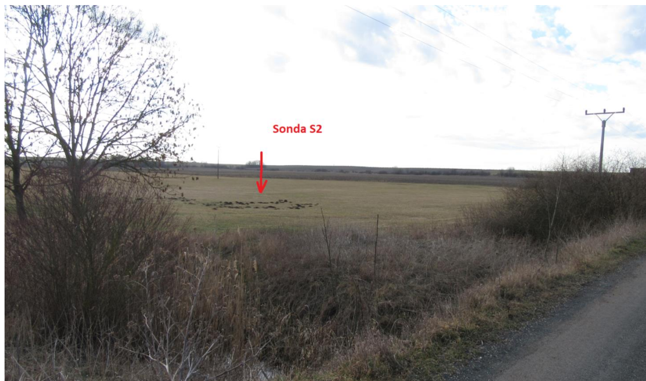
Obr. 7: Umístění S2 v terénu