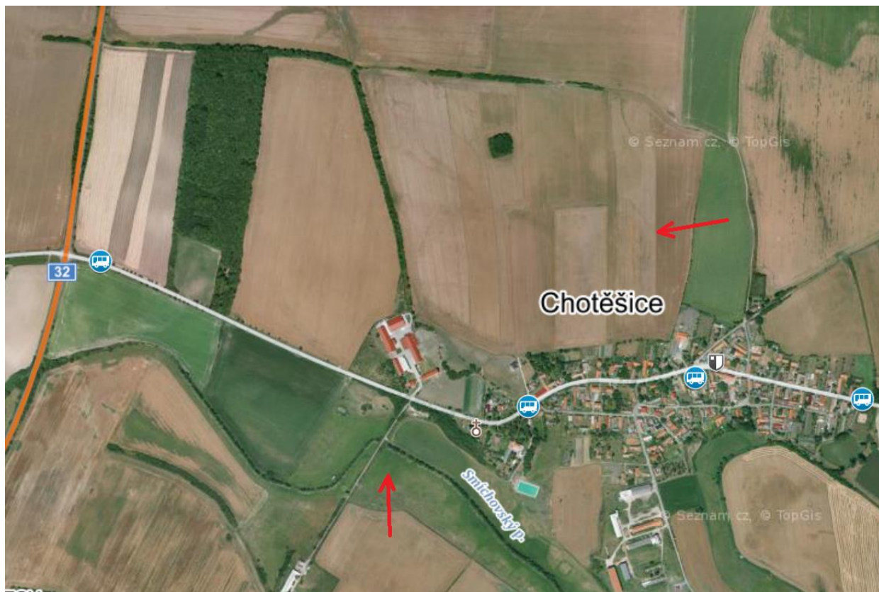
Obr. 2: Situace území