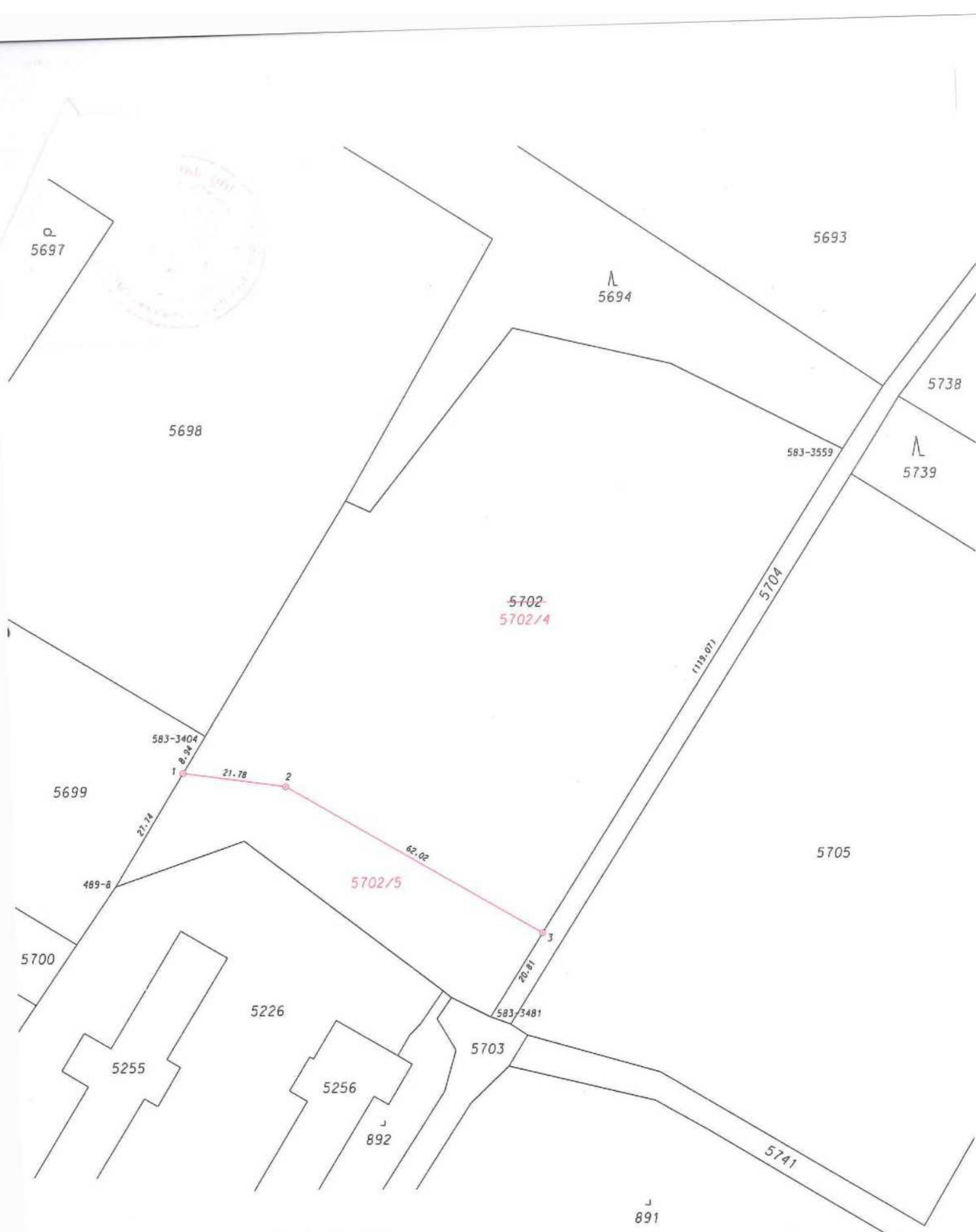
Seznam souřadnic (S-JTSK)