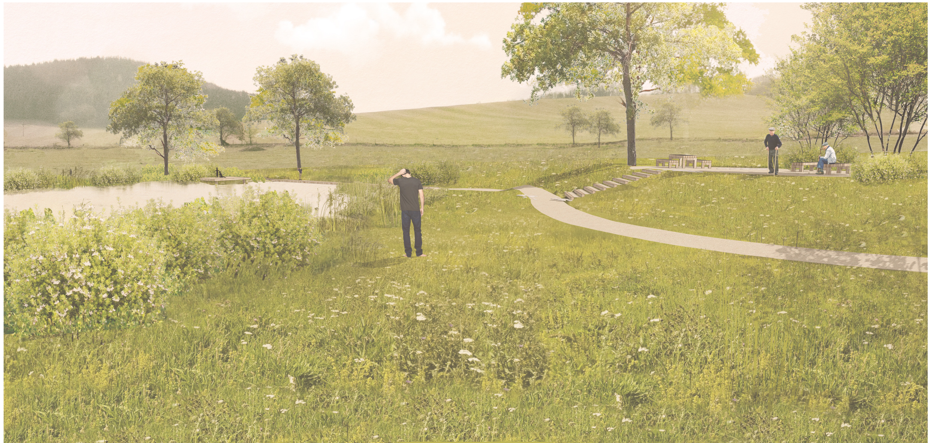
JIŽNÍ POHLED - POTENCIÁLNÍ POBYTOVÉ PLOCHY