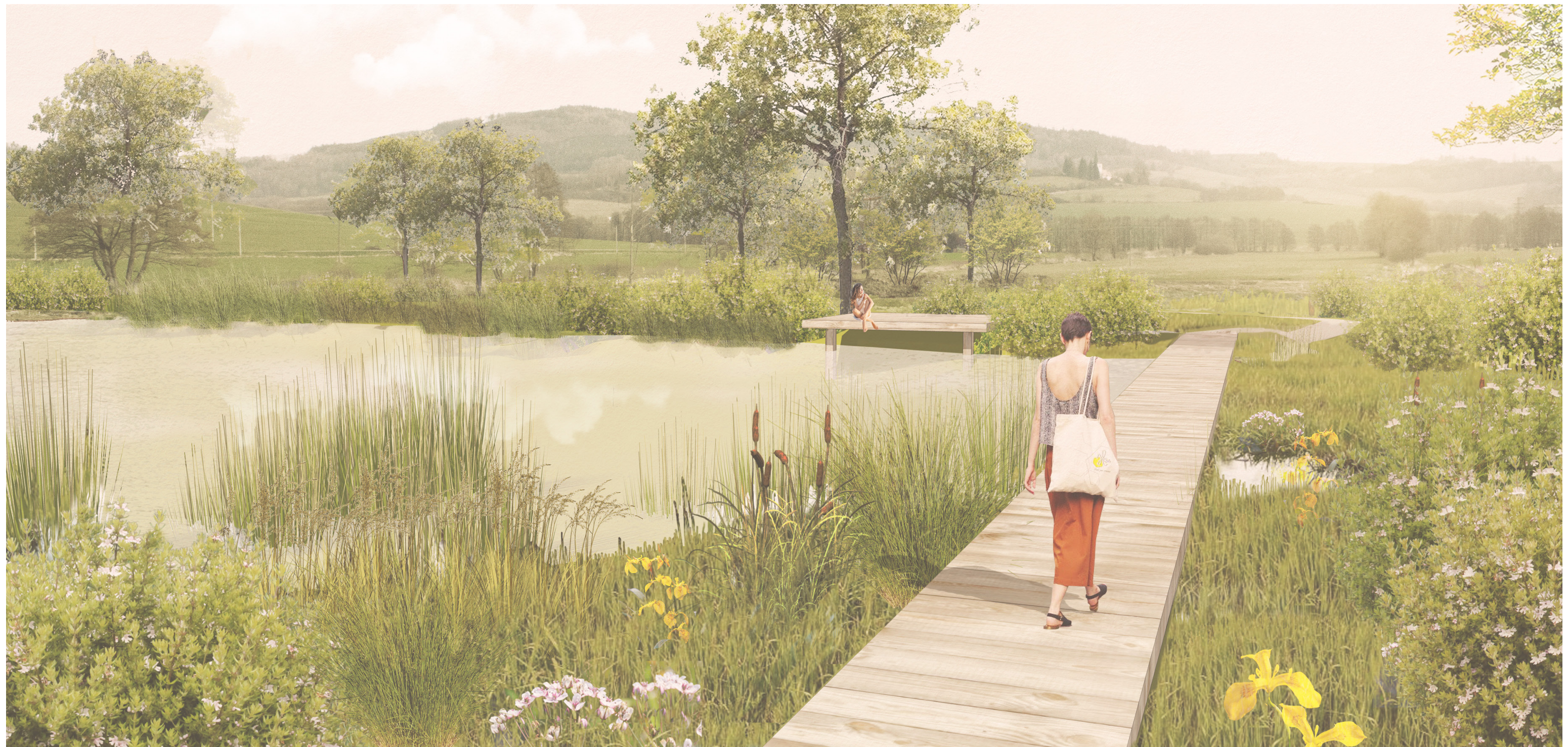
VÝCHODNÍ POHLED - LÁVKA PŘES PT5