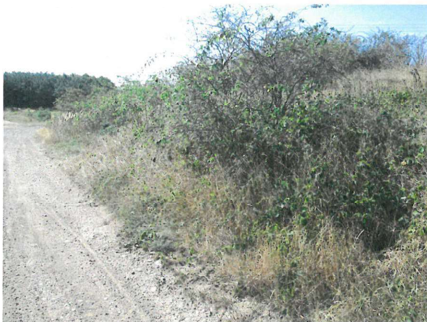
keře – P2