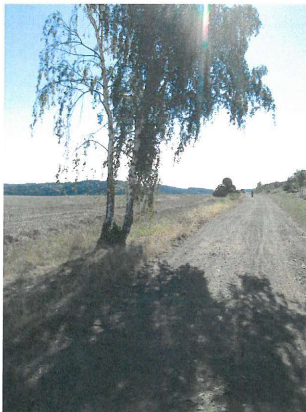
stromy – č.1