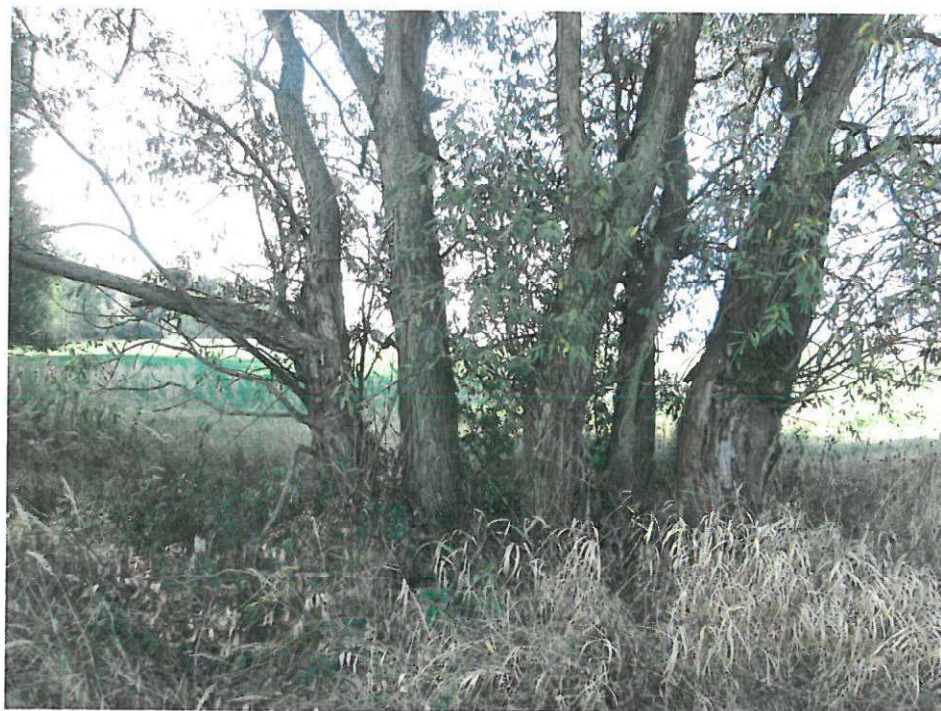
stromy – č.6