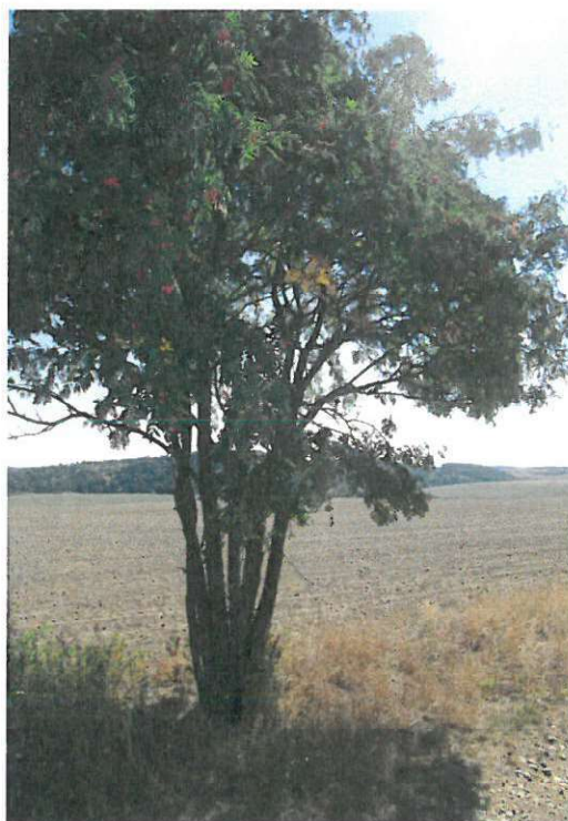
stromy – č.5