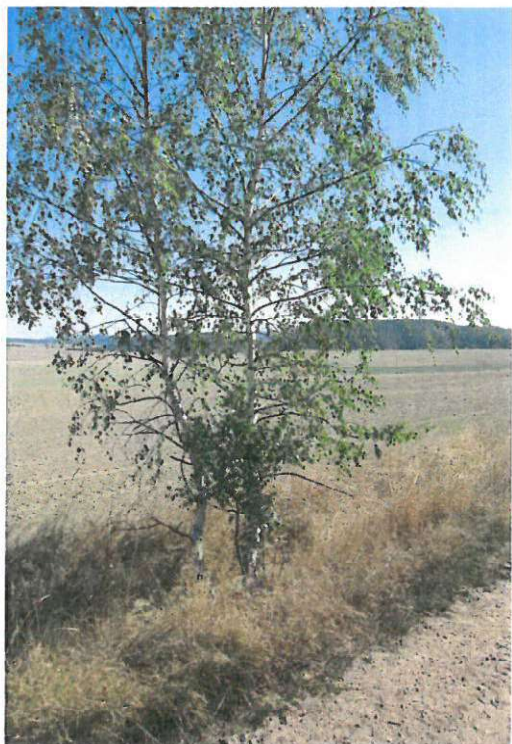
stromy – č.2