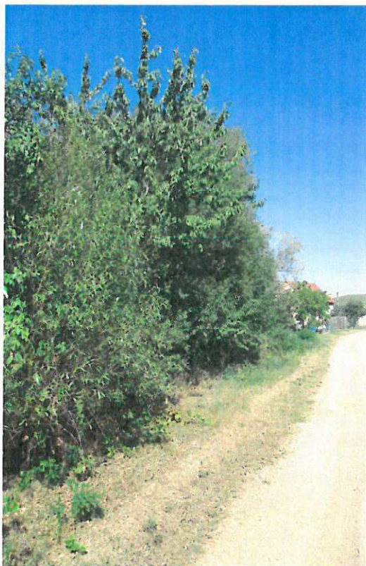
keře – P1