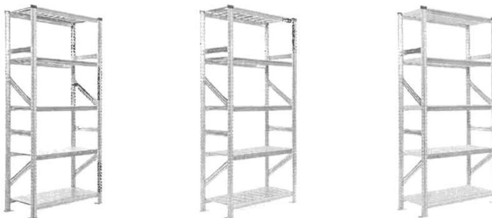
Ilustrativní foto. Příslušenství viz foto, není součástí nabídky.

Všechny regálové konstrukce splňují koeficient bezpečnosti 2,2 – to znamená, že při mezním namáhání unesou regály a jejich komponenty 2,2 násobek jmenovitého plošného zatížení. (Certifikátem TÚV)