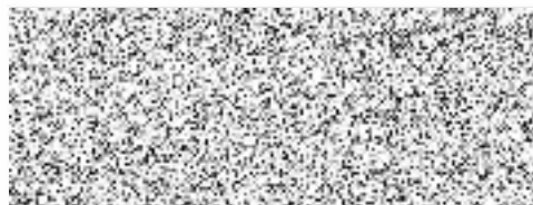
CRAYON - Petr Chocholouš s.r.o. jedenatel zhotovitel