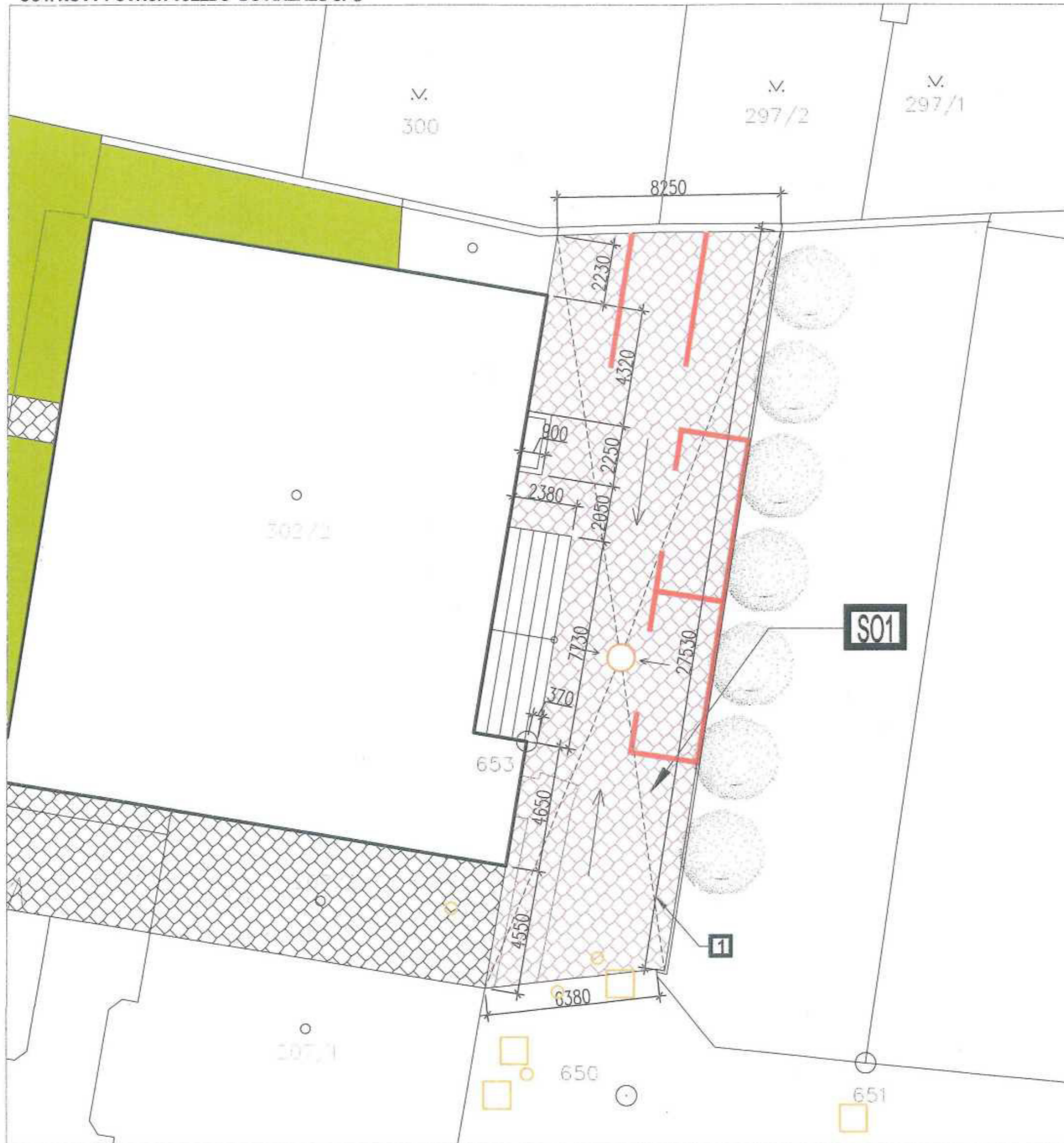
(B1) POJEZDOVÁ ŽULOVÁ DLAŽBA DO 3,5t , povrch-stávající žulové kostky