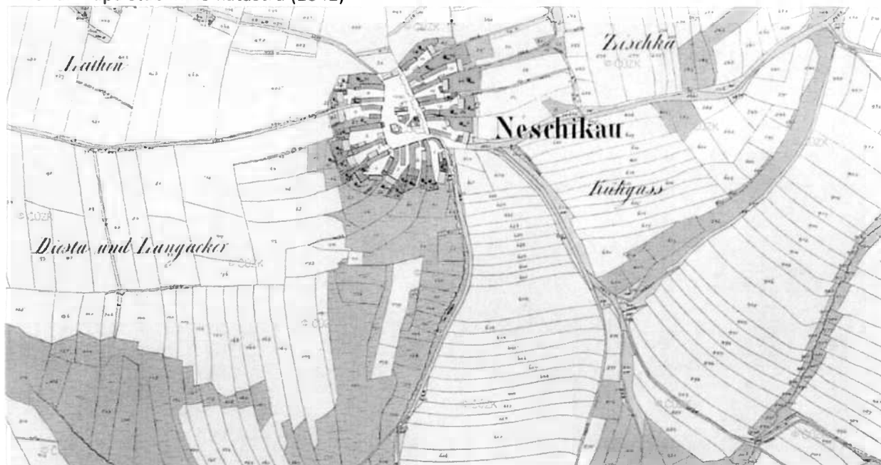
Příloha: mapa stabilního katastru (1842)