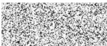
vedoucí odboru dopravy

Stavební povolení pozbývá platnosti, jestliže stavba nebyla zahájena do dvou let ode dne, kdy nabylo právní moci.