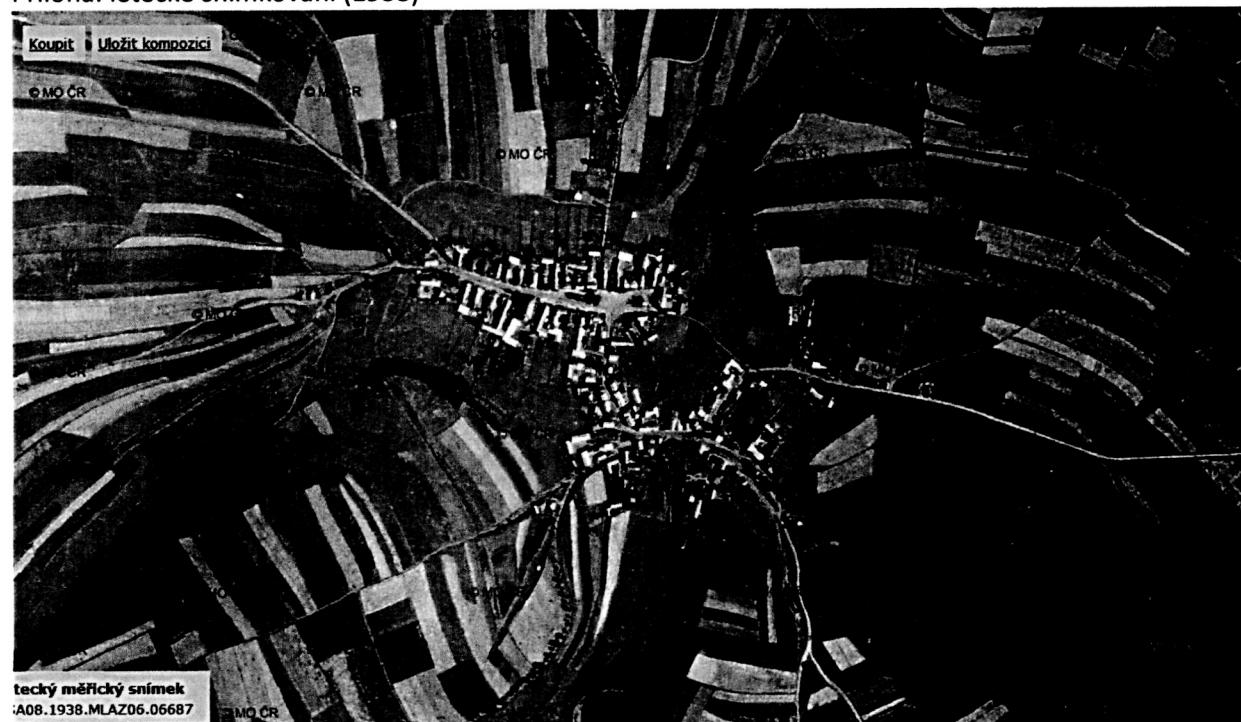
Příloha: letecké snímkování (1938)