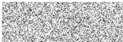
Kubernát Jiří zástavní dlužník